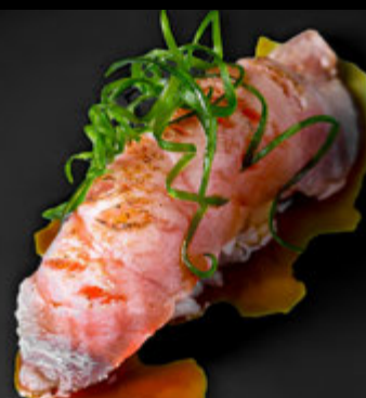
KIMI NO GRILL 14 LEI