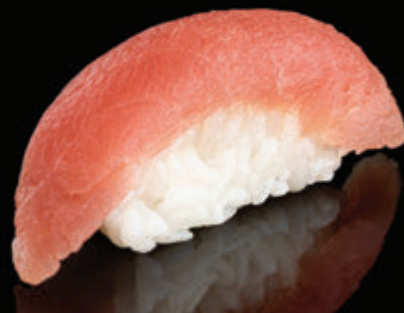
KIMI NO NIGIRI 14 LEI