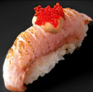
SAKE GRILL 14 LEI