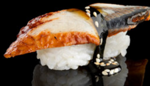
UNAGHI NIGIRI 14 LEI

45 GR ANGHILA , OREZ , SOS UNAGHI, SUSAN