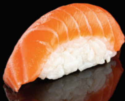
SAKE 14 LEI