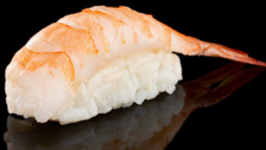
EBI NIGIRI 14 LEI